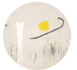
Sala 3 La esperanza del condenado a muerte , 1974