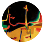
Sala 4 Hombre y mujer frente a un montón de excrementos , 1935