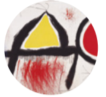
Sala 3 Personaje delante del sol , 1968