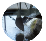
Sala 11-12 (B) Fuente de mercurio Alexander Calder, 1937