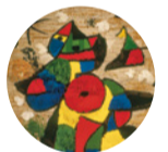
Sala 11 Tapiz de la Fundación , 1979