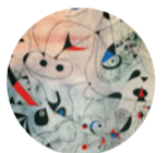
Sala 4 La estrella matinal , 1940