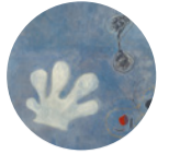
Sala 2 Pintura (El guante blanco) , 1925